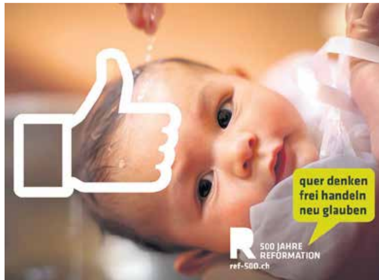
Ein «Like» für reformatorische Grundwerte: Sujet der Plakatkampagne des Schweizerischen Evangelischen Kirchenbundes