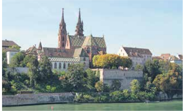
Mächtig auf der Pfalz: das Basler Münster

Aus der Vogelperspektive ist Basel eine Stadt der Kirchen. Stolz erheben sich die Münstertürme auf der Pfalz über dem Rhein. Zahlreiche Baudenkmäler wie die Elisabethen- und Leonhardskirche prägen das Gesicht der Stadt und zeugen vom grossen kirchlichen Erbe. Hier an der ältesten Universität der Schweiz lehrten Erasmus von Rotterdam, Friedrich Nietzsche und Karl Barth.