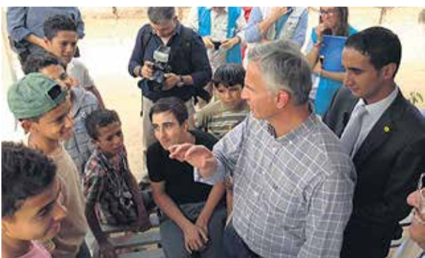
Bundesrat Burkhalter in einem jordanischen Flüchtlingslager

Bundesrat Didier Burkhalter, Vorsteher des Eidgenössischen Departements für auswärtige Angelegenheiten, über die Bedeutung der Reformation in Gesellschaft und Politik.