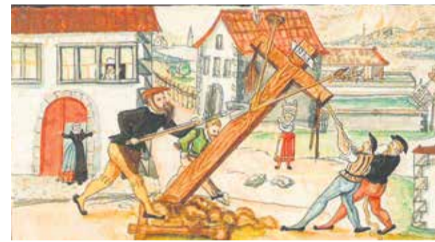
Klaus Hottinger fällt ein Kreuz