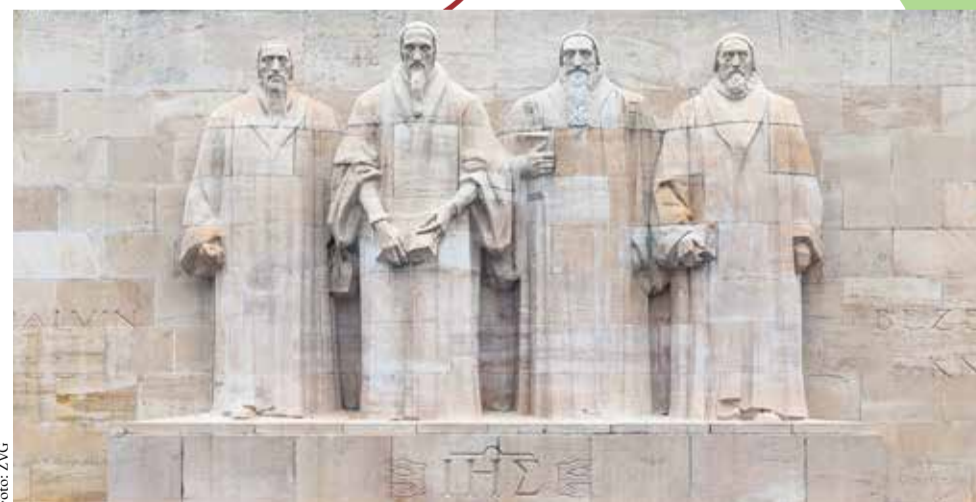
Farel, Calvin, Beza, Knox: Dieses Denkmal erinnert an die Reformation in Genf